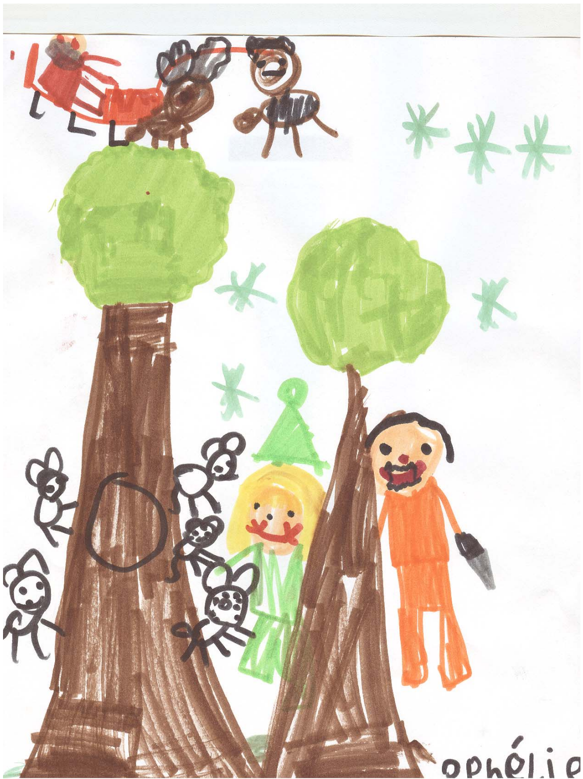
Les Coccinelles croqueuses de lettres